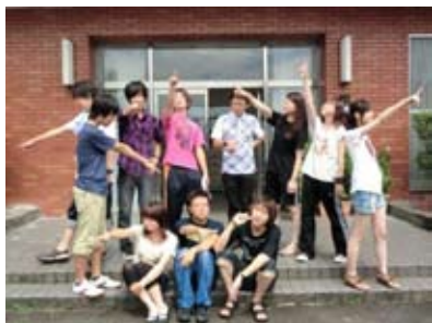
図 1 秋合宿のバリチュー